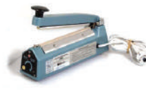
Máquina Selladora AN90®