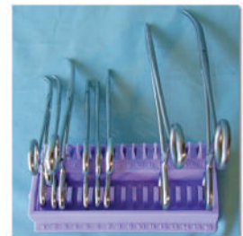
Organizador Instrumental Desechable, Estéril 15 espacios, para quirófano. Cat. 14201