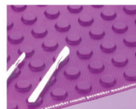
Tapete Desechable, estéril 25 x 40 cm. Cat. AM3121 Tapete Desechable, estéril 40 x 50 cm. Cat. AM3122