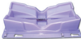
Neutray®, Cat. 17511-A

Elimina el riesgo de punciones por agujas de suturas y cortes con hojas de bisturí accidentales, al pasarlo a una zona neutral sin riesgo para el cirujano y la instrumentista.