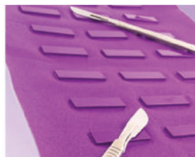
Tapete Reusable, autoclavable 30 x 40 cm. Cat. 11116

Permiten tener una zona donde colocar el instrumental durante la cirugía sin el riesgo de que resbalen dentro de la herida o al piso.