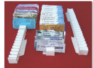
Organizador de Suturas para 10 y 20 piezas Cat. 13205 y 13210

Permiten organizar las suturas, teniéndolas a la vista y permite contar las suturas que han sido utilizadas. Contiene adhesivo inferior para pegarse en la mesa de mayo. Desechable, estéril.