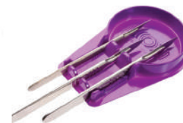
Charola protectora para Bisturí. Cat. AM1593