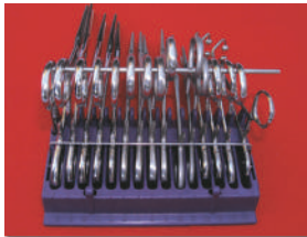
Organizador Instrumental 15 espacios con seguro y guía de apertura. Cat. 14301

ORGANIZADORES DE INSTRUMENTAL Reusables y desechables. Para 15, 16 ó 30 piezas, con seguro y con guía para mantener el instrumental. Permiten organizar todo el instrumental durante el proceso de esterilización y en quirófano permite el conteo y manejo sin desorden.